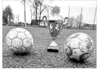
«Колос» – ПП ім. Калашника – 6 : 1

МІНУЛИХ вихідних у Коломацькому (група «А») й Плоському (група «Б») завершився груповий етап II-го, традиційного, відкритого весняного турніру Місцевого осередку ГО «ВФСТ «Колос» 2023 року у Полтавському районі з міні-футболу пам'яті Ступаря Віталія Максимовича. Визначилася четвірка команд, яка поведе боротьбу за головний трофей змагань.