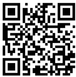
qr-code сайт Полтавська РВА