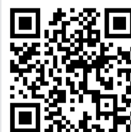
qr-code Фейсбук – сторінка Полтавська РВА