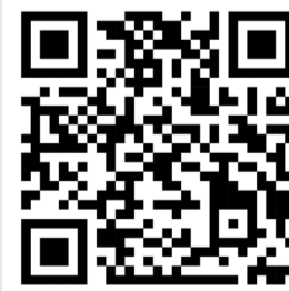
Карта захисних споруд Полтавської області