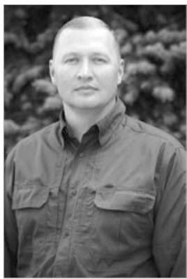
Дмитро РОМАНОВ, начальник Полтавської районної військової адміністрації