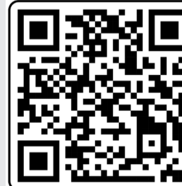
Карта захисних споруд Полтавської області